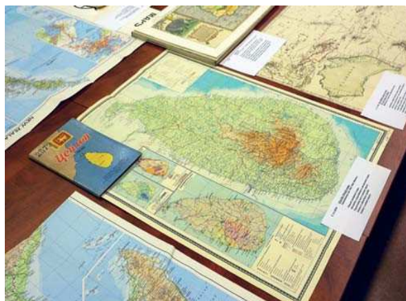
Obr. 8.2 Ukázka vystavených map