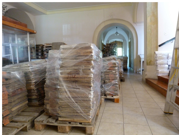
Obr. 8.4 Archiválie připravené k převozu

V roce 2016 budou převezené archiválie postupně vybalovány a ukládány do připravených regálů. Založení pardubického depozitáře a všechny související práce (zejména vytvoření nového lokačního plánu uložení jednotlivých fondů a sbírek) bude naléhavým úkolem archivu v roce 2016.