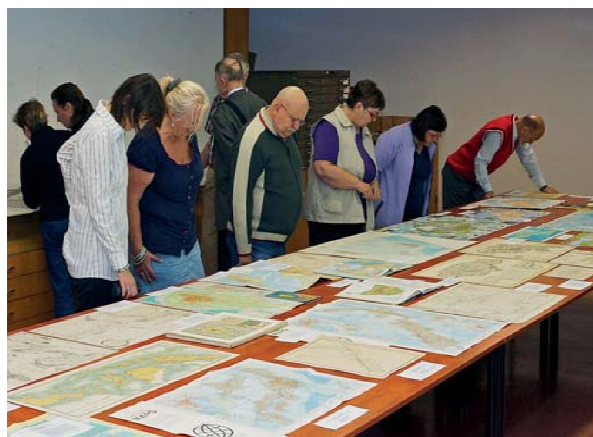
Obr. 8.1 Návštěvníci výstavy v ÚAZK

Pro zaměstnance budovy zeměměřických a katastrálních úřadů a pro pozvané kolegy ze spolupracujících institucí byla opět uspořádána tradiční jednodenní výstava, tentokrát na téma „Mapy ostrovů“ (obr. 8.1, 8.2).