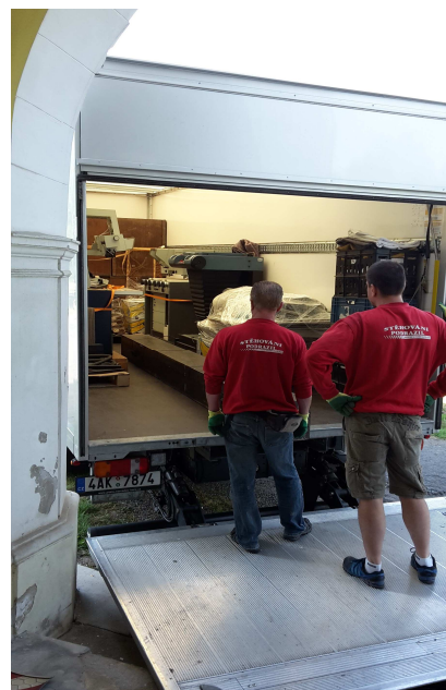
Obr. 8.5 Nakládání sbírky přístrojů