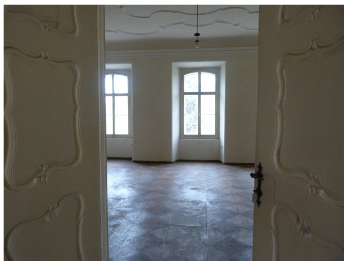
Obr. 8.8 Jedna z vystěhovaných místností zámku