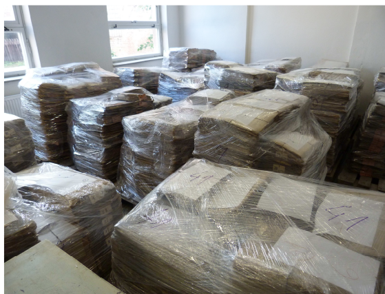
Obr. 8.7 Nový depozitář se rychle zaplňuje