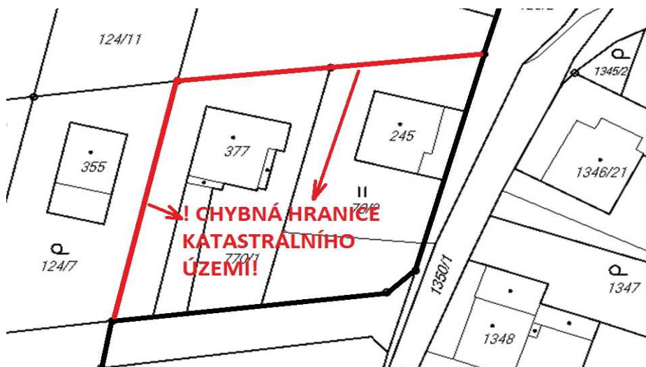
Obrázek 1 - chybná hranice katastrálního území

Jedná se o případ, kdy je hranice katastrálního území chybně zakreslena v analogové katastrální mapě (Obrázek 1).