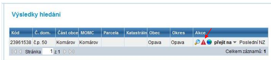
Obr. 4: Zobrazení nesprávnosti v přehledu prvků

Zobrazení nesprávnosti v přehledu prvků přibližuje obr. 4.