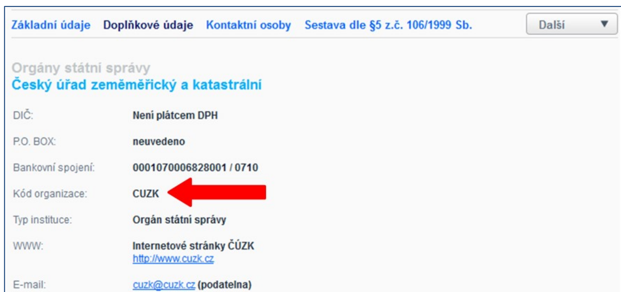
Obr. 3: Portál veřejné správy

Nebo na Portále veřejné správy v Seznamu datových schránek na adrese http://portal.gov.cz .